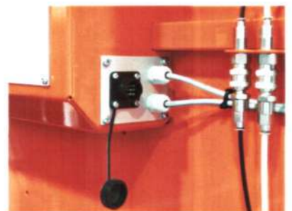
Подключается к выходу для аксессуаров